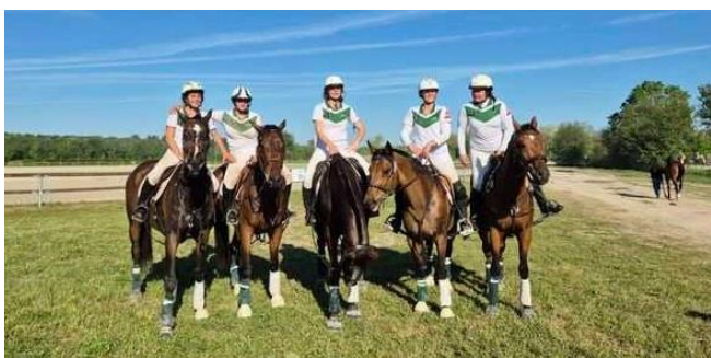
L'équipe des championnes de France de Horse Ball

Les féminines sénior (photo) championnes de France de Horse Ball à La Motte Beuvron (Loir et Cher) dans le club Elite féminine. L'équipe « sénior mixte » de Horse-ball a obtenu sa 2ème médaille d'or pour Limogne avec l'équipe masculine.