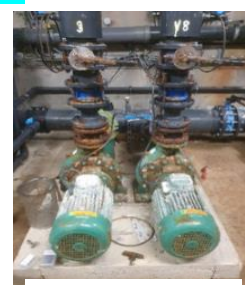
Avant le changement