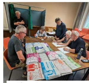
Le dépouillement du 9 juin

Nous attendons que les nouveaux élus soient attentifs à nos besoins. Notre vote a une influence sur notre avenir commun. Limogne votera pour la liberté, l'égalité, la fraternité.